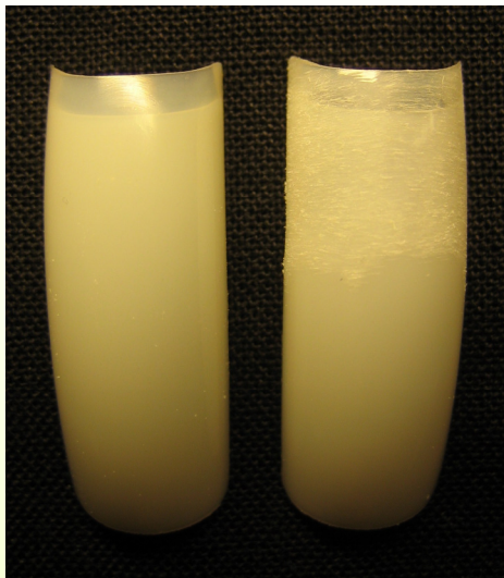
Links een ongevijlde tip; rechts een gepre-blende tip.

Een tip dient puur ter verlenging van een kunstnagel en draagt niet bij aan de sterkte van een kunstnagel. Vandaar ook dat het opzetstukje volledig transparant en de tip zo dun mogelijk gevijld moet worden. Als de tip eenmaal op de nagel gelijmd zit, is het uitdunnen van de tip een tijdrovend en precies karweitje.